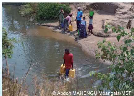
川の水をくむ人びと。不衛生な水の利用は病気の原因 となる。(コンゴ)