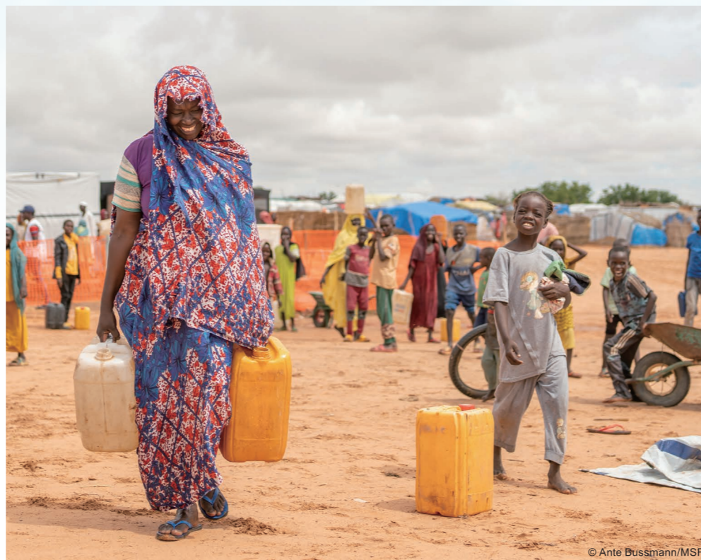
家族のために、MSFの給水所から得た水運ぶ 難民キャンプに暮らす母親。水を手当てしてほっ としたからか、笑みがこぼれた。(チャド)

低限必要とされている水の量は、 1日1人当たり約20リットル ※2 。 これらは、飲料水や調理、体の洗 浄などに利用されます。