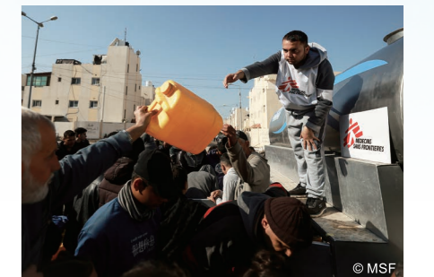
人びとのために懸命な給水活動が続いた。(ガザ= 2024年)

パレスチナ・ガザ地区では、海 水の淡水化支援も行いました。ガ ザには飲用できる安全な天然水が ないことから、イスラエルからの 給水か、海水の淡水化が必要で す。しかし攻撃で水インフラ施設が破 壊され、安全な水が不足。疥癬 かいせん などの皮膚疾患や下痢のまん延に つながっています。