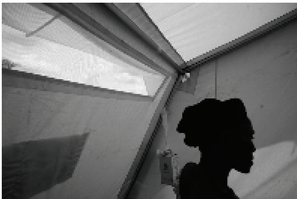
アンゴラ軍兵士にレイプされた後、DRCの西カサイ州、カマコに国外追放されたコンゴ人女性。2007年11月撮影：© Cédric Gerbehaye/MSF