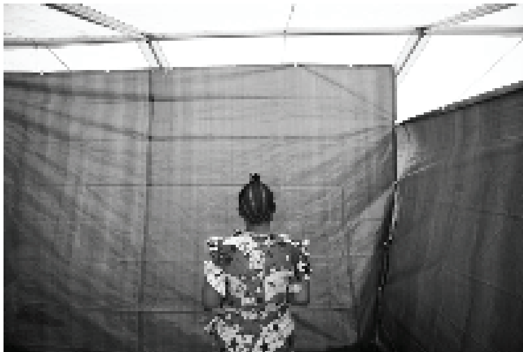
アンゴラ軍兵士にレイプされた後、DRCの西カサイ州、カマコに 国外追放されたコンゴ人女性。2007年11月撮影：© Cédric Gerbehaye/MSF