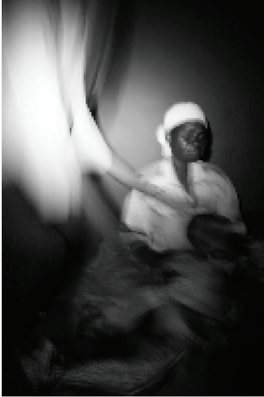
アンゴラ軍兵士にレイプされた後、DRCの西カサイ州、カマコに 国外追放されたコンゴ人女性。2007年11月