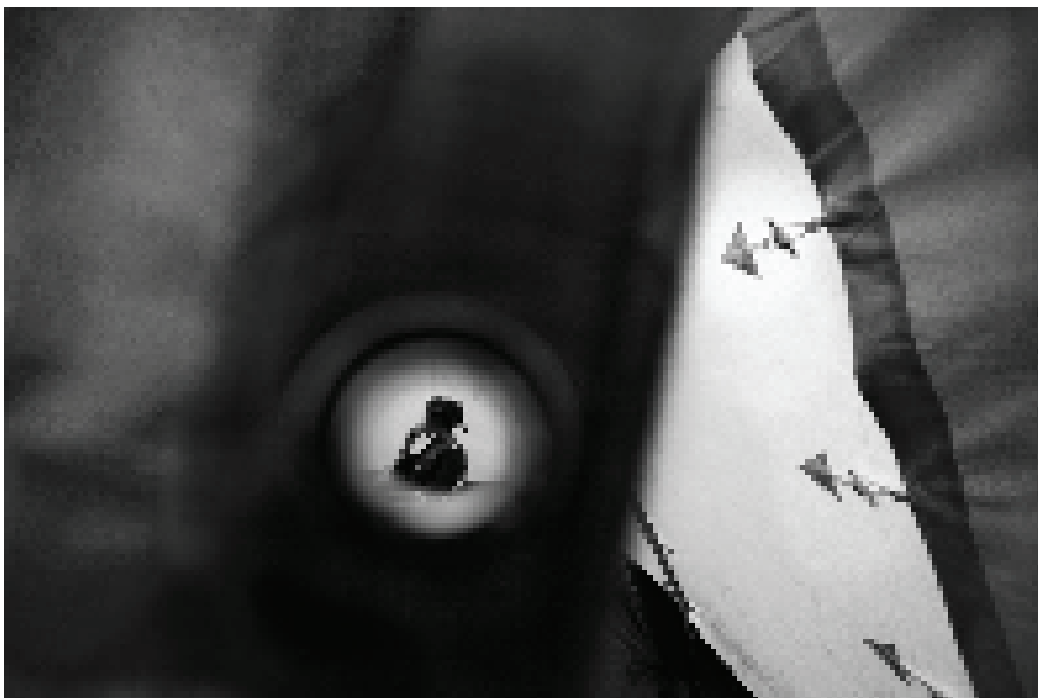
アンゴラ軍兵士にレイプされた後、DRCの西カサイ州、カマコに 国外追放されたコンゴ人女性。2007年11月撮影：© Cédric Gerbehaye/MSF